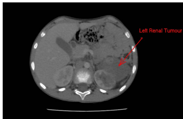
Figura 2. Tumor renal izquierda posquimioterapia

Después de la quimioterapia, se evidenció respuesta satisfactoria con relación al tumor y su invasión vascular (Figura 2). El equipo de cirugía pediátrica indicó nefrectomía radical izquierda, cavectomía y linfadenectomía retroperitoneal.