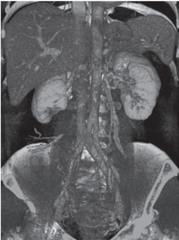
Figura 2. Angio-TC pós-operatória evidenciando drenagem da veia renal pelas colaterais, veias gonadais e suprarenais esquerdas

seguimento ambulatorial, foram realizados exames complementares para avaliação da função renal, apresentando exame de urina com ausência de proteinúria. A angiotomografia computadorizada (angio-TC) evidenciou drenagem da veia renal esquerda por meio das veias gonadais e suprarenais esquerdas, nefrograma com aporte sanguíneo renal bilateral preservado, fase parenquimatosa e excretora em tempo hábil, e cintilografia renal estática com DMSA 99mTc evidenciando função renal diferencial relativa de 44% no rim direito e 56 % no rim esquerdo (Figura 2).