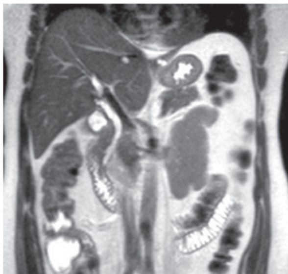
Figura 1. Exame de imagem com evidência de lesão tumoral, retroperitoneal, comprometendo veia cava inferior

Primeiro caso: Paciente, sexo feminino, 56 anos, com quadro de dor em barra em abdômen superior e dorso, com um ano de duração dos sintomas. Apresentando na ressonância magnética (RNM) formação retroperitoneal indissociável do processo uncinado do pâncreas e da veia cava inferior (Figura 1), em sua porção infrarrenal, com extensão ao óstio da veia renal esquerda, poupando a inserção das veias gonadal e suprarrenal deste lado.